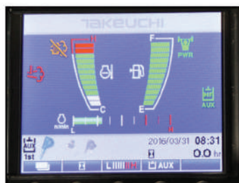
ECRAN MULTI FONCTIONS