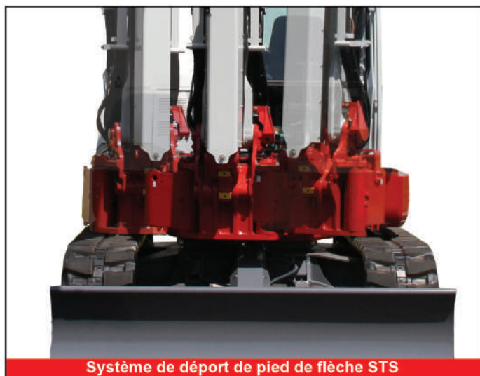
Système de déport de pied de flèche STS