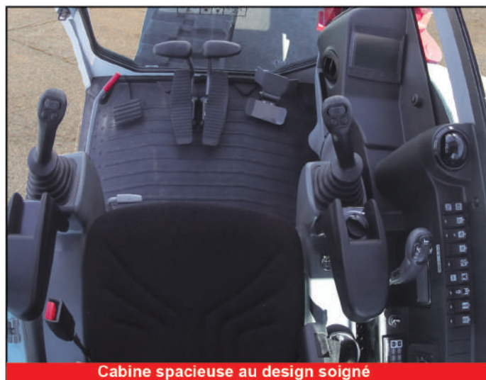
Cabine spacieuse au design soigné

*Certaines fonctions ou spécifications ne sont pas disponibles dans tous les pays merci de contacter votre concessionnaire.