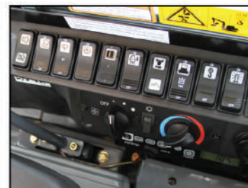
Pannel de contrôle lateral